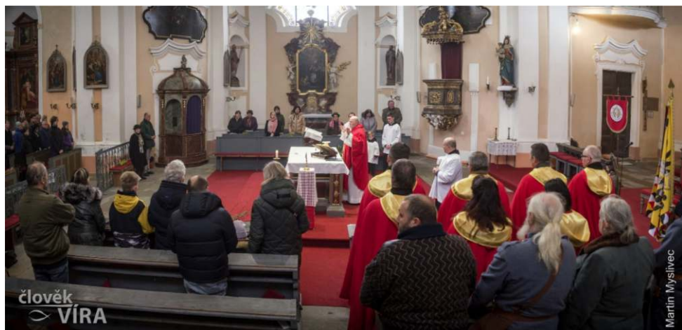
Mše svatá za účasti členů Matice