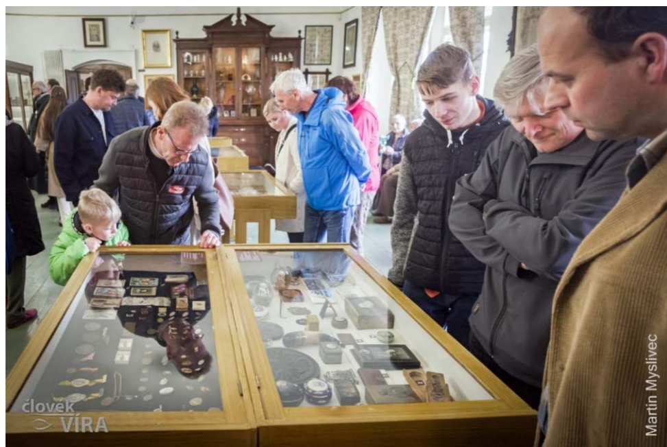
Výstava „Za císaře pána“

Přijďte se podívat na výstavu různorodých předmětů denní potřeby s motivem císaře (což je dokladem velké loajality k panovníkovi), ale i na předměty, jež používal císař osobně. Exponáty pocházejí nejen z území rakousko-uherské monarchie, ale