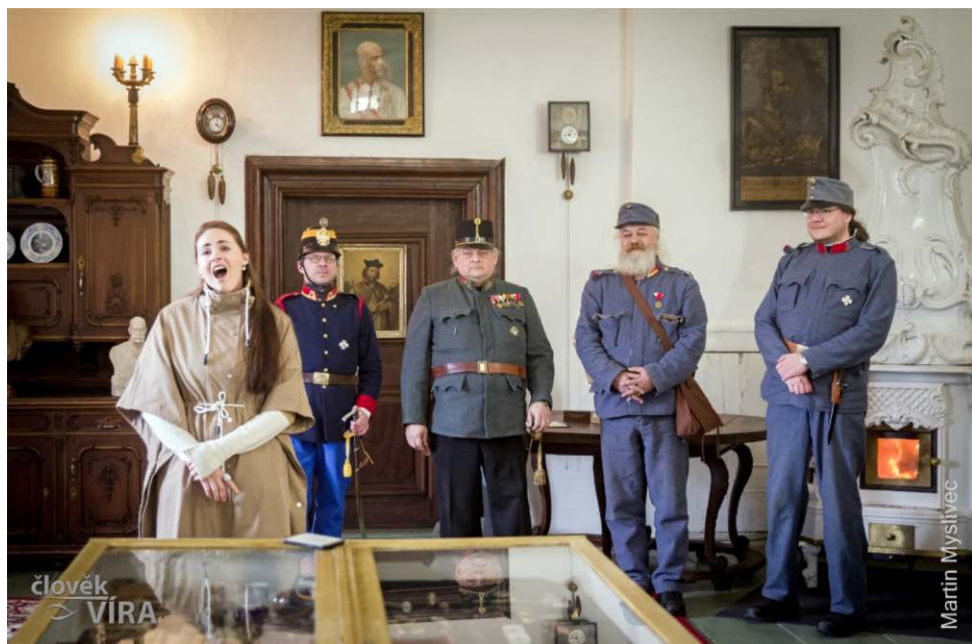
Odpolední program – Vernisáž výstavy „Za císaře pána“

Časopis JOHÁNEK vydává Matice sv. Jana Nepomuckého, Přesnické nám. 1, 335 01 Nepomuk. Evidenční číslo MK ČR E 24136. Časopis je neprodejný.