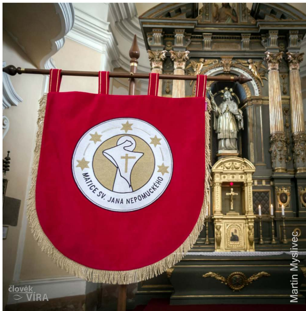
Při jarní pouti byla posvěcena nová vlajka Matice sv. Jana Nep.