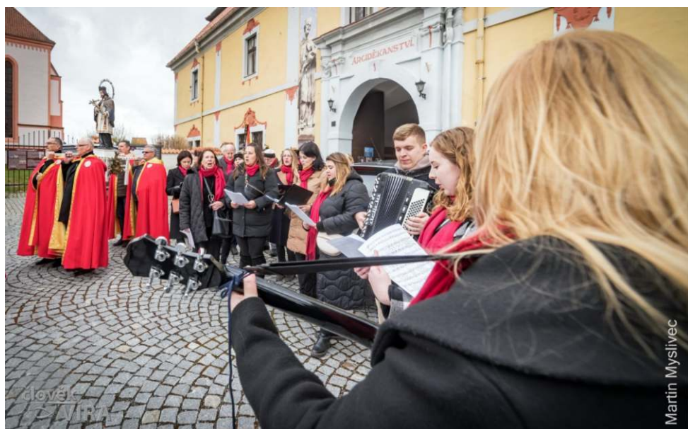
Procesí a mši svatou doprovázel sbor Canto Nepomucenum