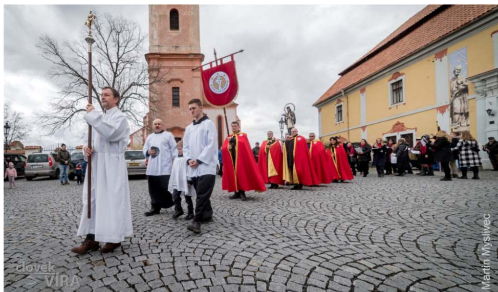
Procesí od Arciděkanství do kostela sv. Jana