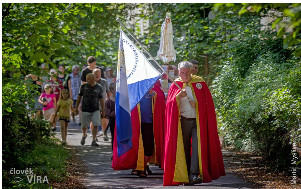
Zelená hora je opravdu zelená