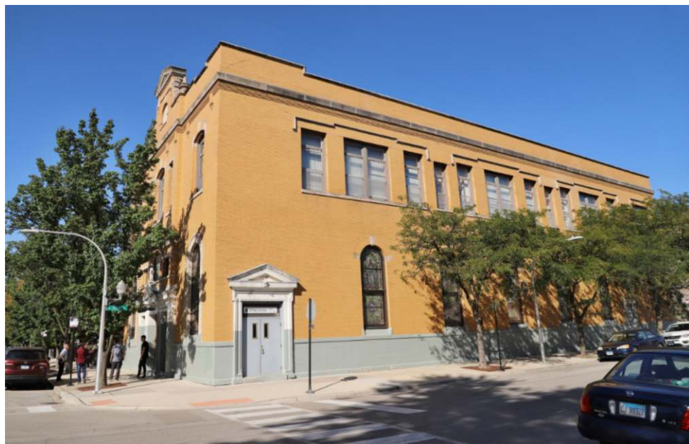
Bývalý kostel sv. Jana Nepomuckého v Chicagu