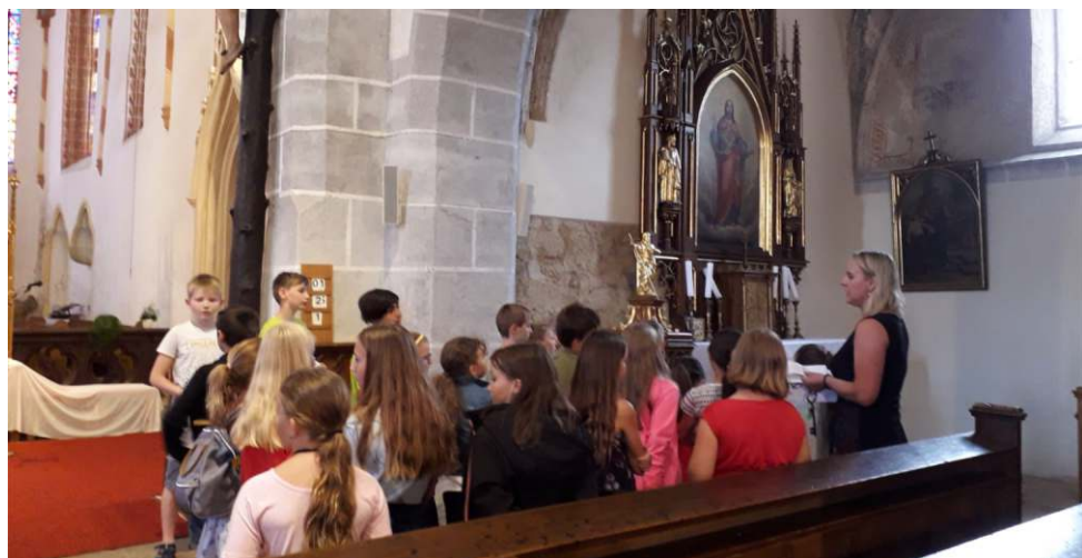
Edukační program pro školy „Po stopách sv. Jana Nepomuckého“ ve Svatojánském muzeu v Nepomuku

Časopis JOHÁNEK vydává Matice sv. Jana Nepomuckého, Přesaničké nám. 1, 335 01 Nepomuk. Evidenční číslo MK ČR E 24136. Časopis je neprodejný.