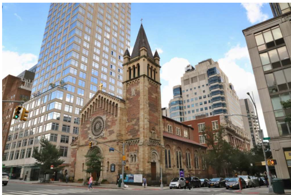
Kostel sv. Jana Nepomuckého v New Yorku