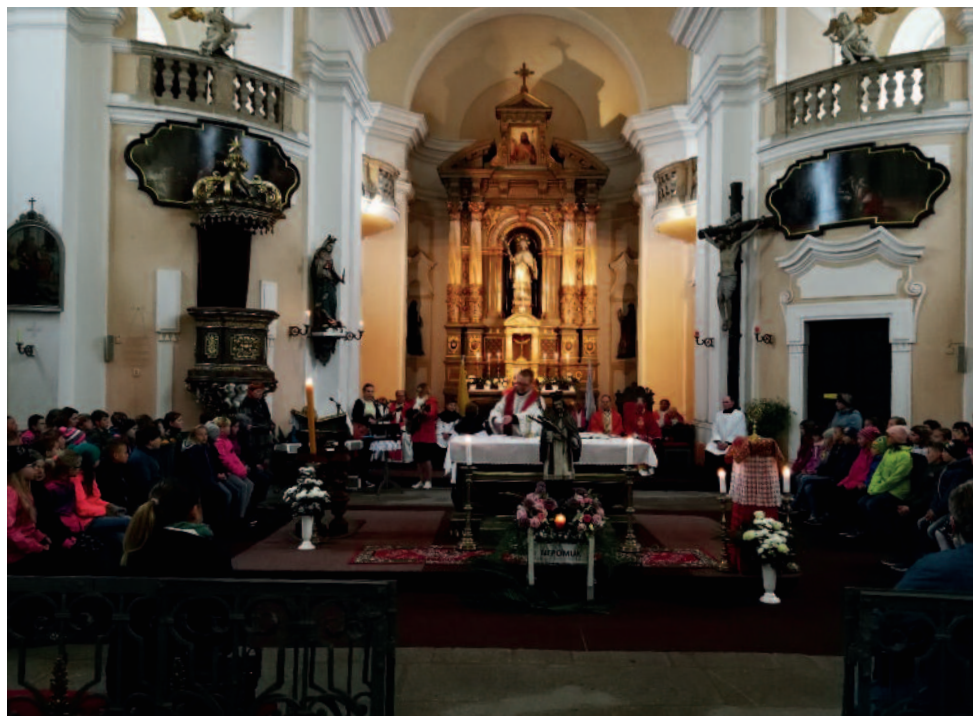
Dětský sbor zcela zaplnil boční prostory kostela SJN 16. 5. 2019.